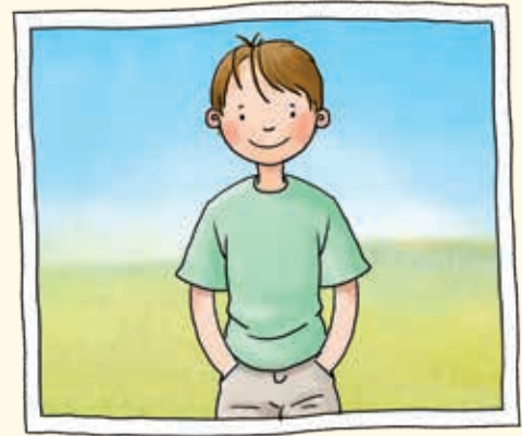
Normalsicht (auf Augenhöhe)