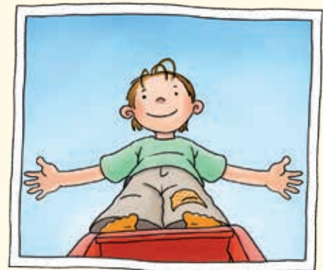
Untersicht / Froschperspektive